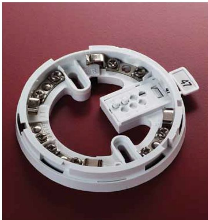
Монтажная база XP95